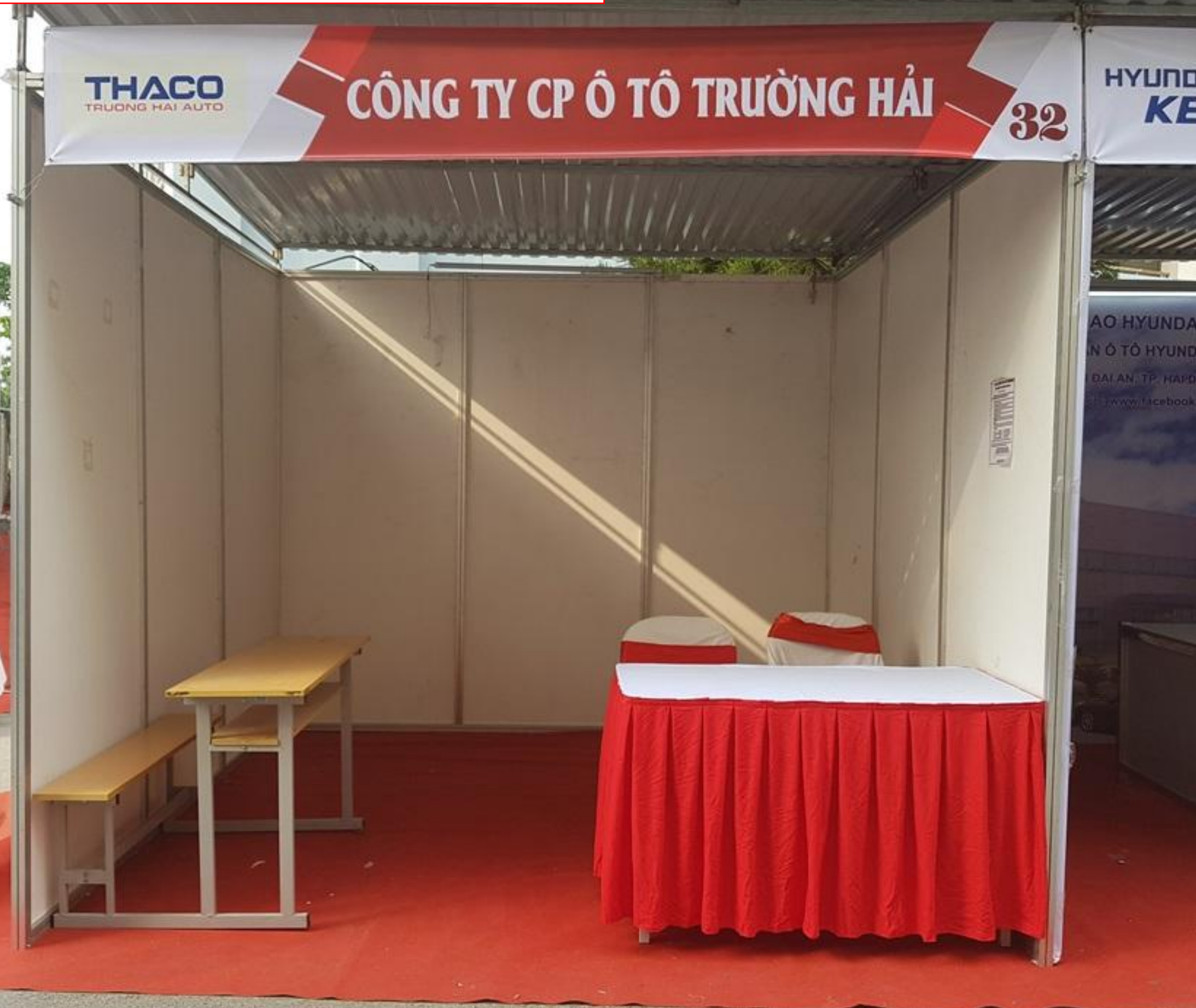
Phụ lục D: Ảnh gian hàng tiêu chuẩn