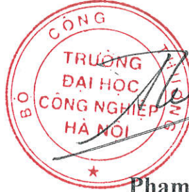
Phạm Văn Đông